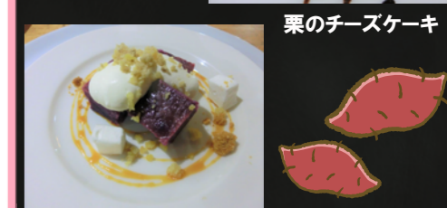
紫芋のスイートポテト