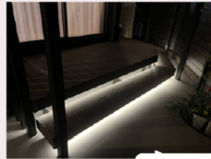
夜はデッキがライトアップ