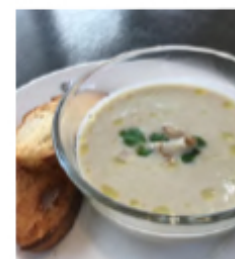
菊芋と豆乳のポタージュ イヌリンが腸の働きを良くする