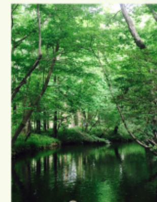
お庭のお手入れお庭番 植木のお手入れのご相談は 0463-58-0520(土日祝定休)