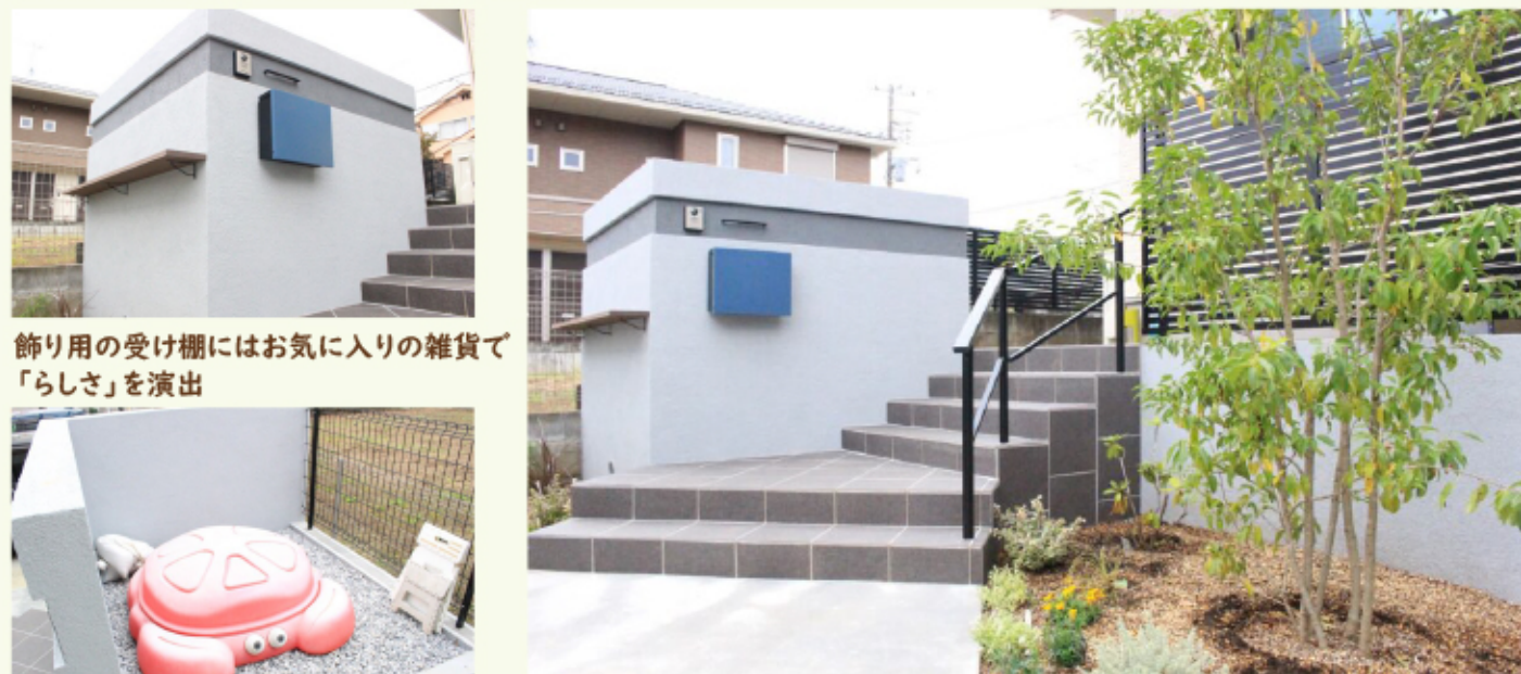
飾り用の受け棚にはお気に入りの雑貨で「らしさ」を演出