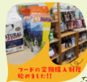
フードの定期購入制度 始めました!!

①については、適切なたんぱく質、脂質、そして隠れたポイントは糖質の量ですね!適度な糖質制限が大切です。40%以下くらいが一般的には理想かと思えます。春のとっても気持ちよい季節です。フードでお悩みのある方も、愛犬と一緒にドックランに遊びに来てくださいな。 文/花粉症の影響が出てきた上野でした。