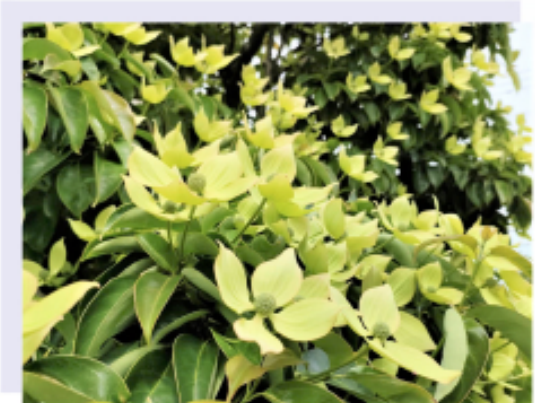
常緑ヤマボウシ お庭のお手入れお庭番 植木のお手入れのご相談は 0463-58-0520(土日祝定休)