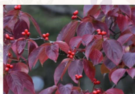
紅葉も抜群「ハナミズキ」 花は有名ですが紅葉もきれいってご存じでしたが？ 赤い実もついて冬も見応え有