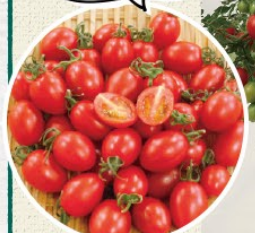
高糖度ミニトマト シュガープラム