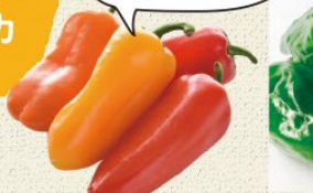
ミニパプリカスナックシリーズ