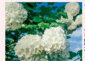
ビバーナムスノーボール