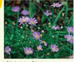
ブラキカムプラスコ