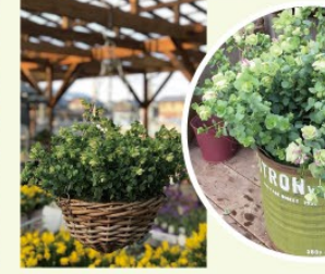
オレガノセントビューティー