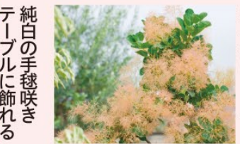
スモークツリー未開花株