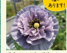
ポビーアメイジンググレイ