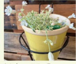
シレネユニフローラ