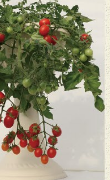
ジャングルトマト