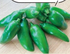
こどもピーマン ピー太郎

その他入荷品種 とうがらしサラダ甘長・とうがらし伏見甘長・万願寺とうがらし・京波ピーマン