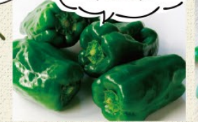
ピーマン京みどり