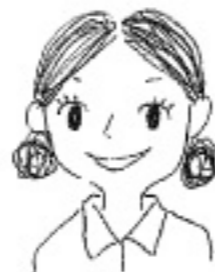
友達と桜を見に行くのが待ち遠しい 鎌田

外構・お庭のお困りごと等は、ガーデン&エクステリア事業部 まで ☎ 0120-152-887 [ダイヤル2番]